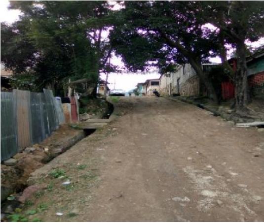
Se observa el ancho y el estado actual de la calle.