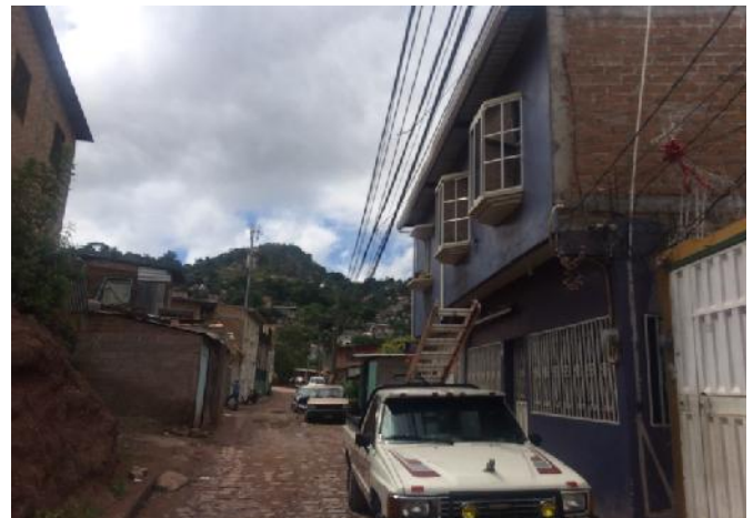
Panorama de calle a pavimentar con white topping.