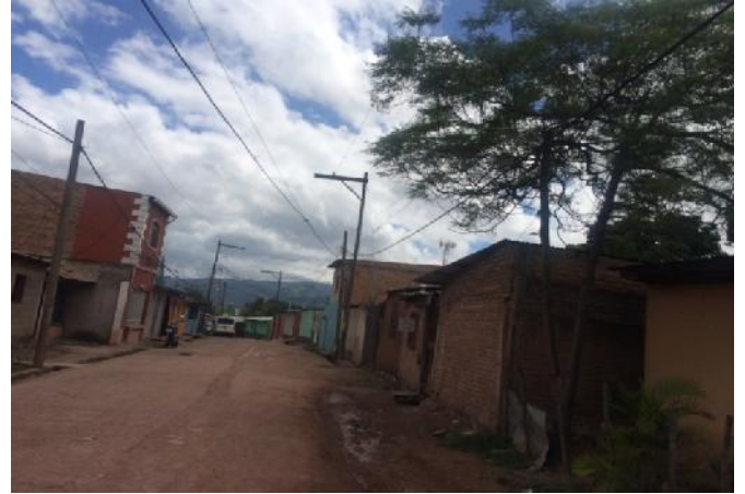
Calle a pavimentar con concreto hidráulico .