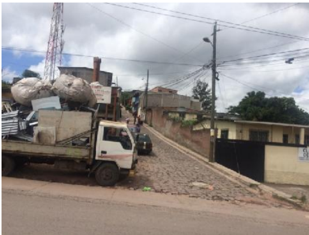
Inicio de calle a pavimentar con white topping.