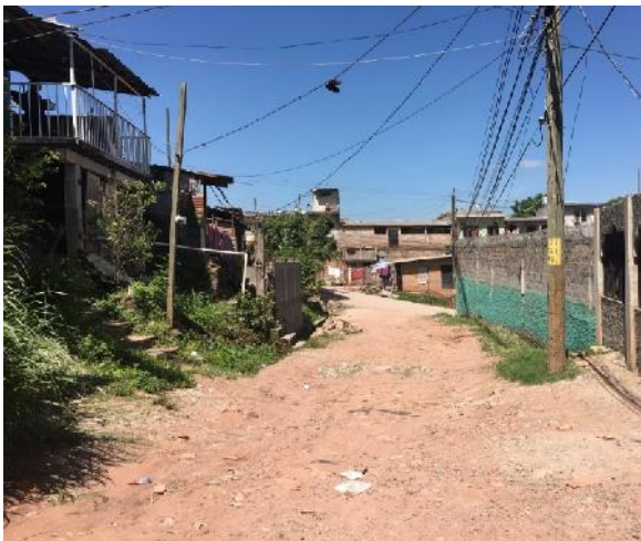
Estado actual de la calle a pavimentar