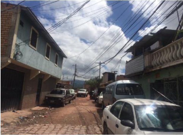
Vista de tramo donde se une pavimento de concreto hidráulico con white topping.