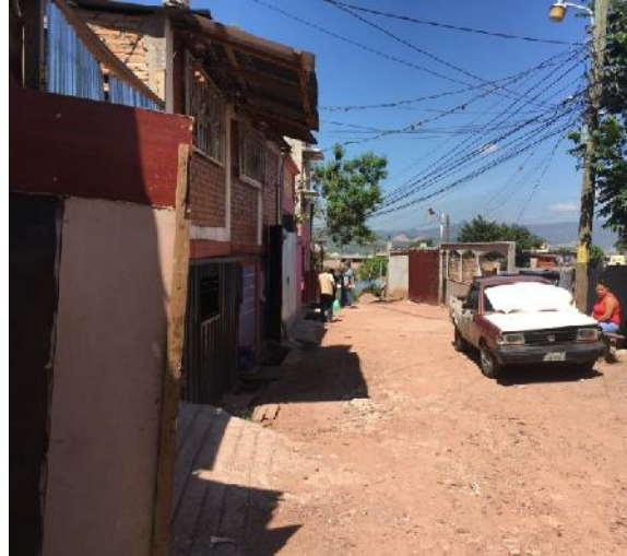
Tramo intermedio de la calle a pavimentar