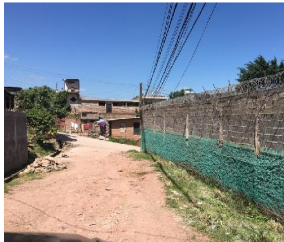
Final del tramo a pavimentar