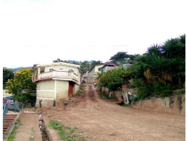
Se observa el ancho y el estado actual de la calle.