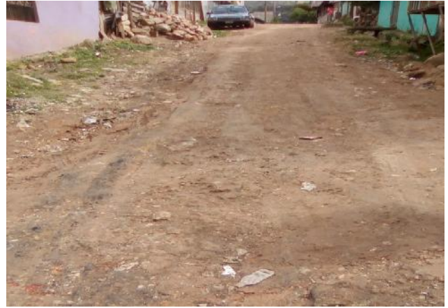
Se observa el ancho y el estado actual de la calle