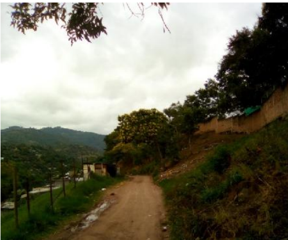
Se observa el ancho y el estado actual de la calle.