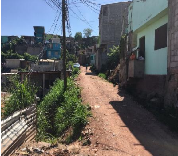
Inicio del tramo de la calle a pavimentar