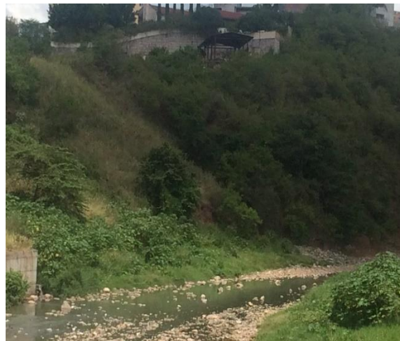
VISTA DEL ESTADO ACTUAL DONDE INICIA MURO DE CONTENCIÓN.