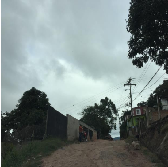
Estado Actual de Calle.