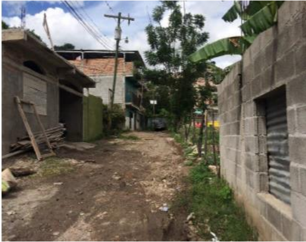
Vista de calle a reparar.