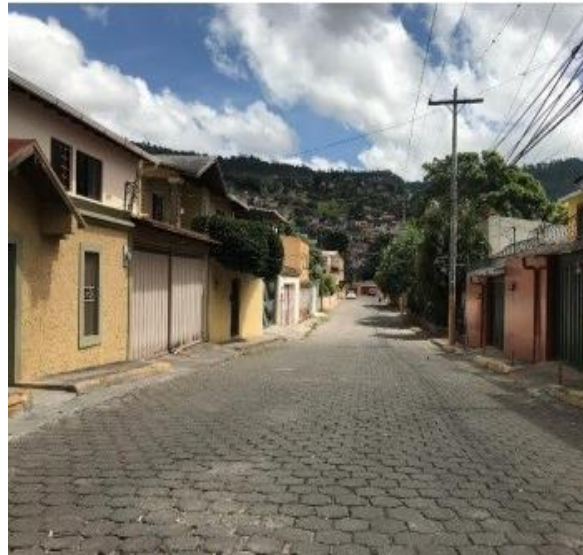
VISTA FINAL DE CALLE A PAVIMENTAR .