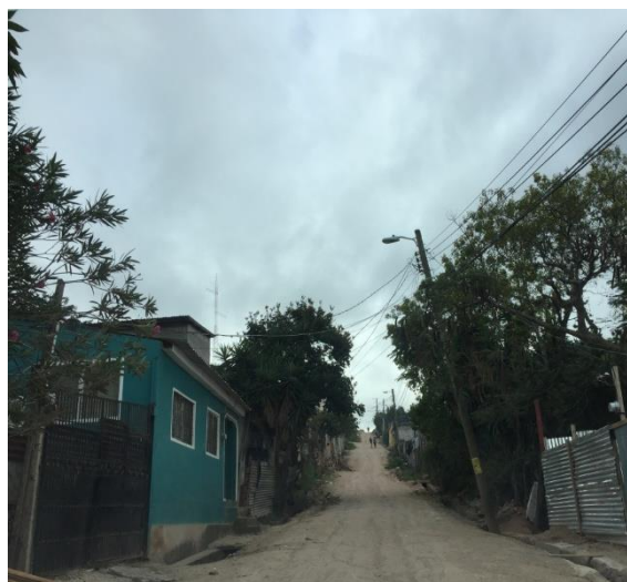
Panorama de calle en col nueva suyapa, sector 4, bloque 16.