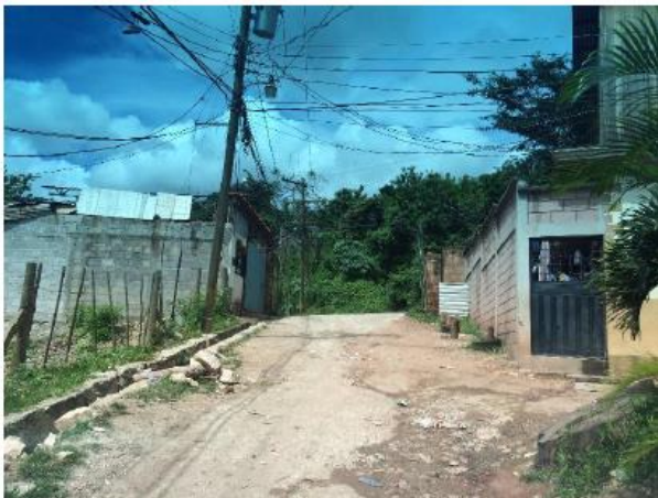
Vista de calle a pavimentar