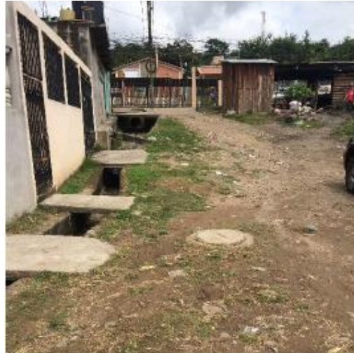
Vista Panorámica de calle a pavimentar.