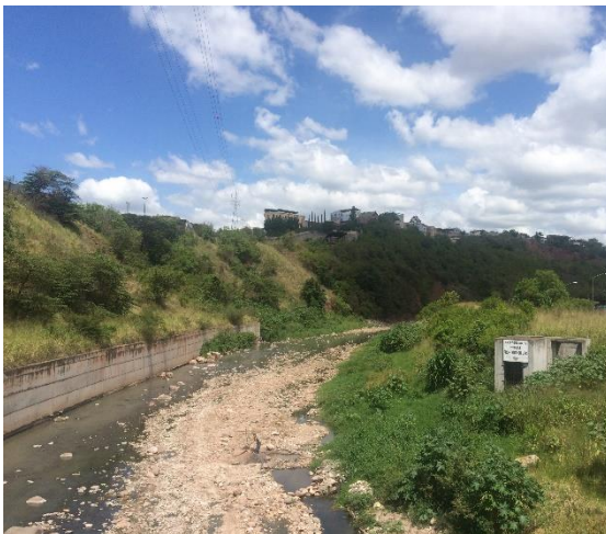
VISTA DE CONTINUACIÓN DE MURO