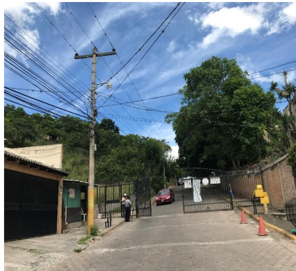
UBICACIÓN DEL PORTON DE ACCESO A LA COLONIA LA CAMPAÑA.