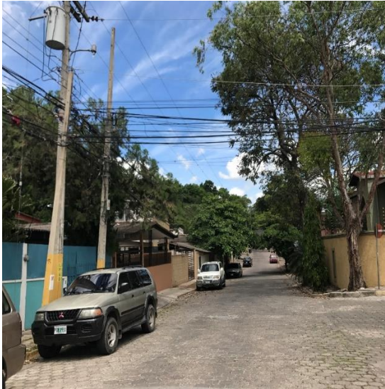
VISTA DE CALLE A PAVIMENTAR CON CONCRETO HIDRÁULICO.