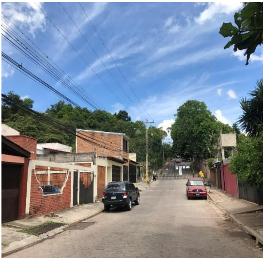
INICIO DE CALLE A PAVIMENTAR CON CONCRETO HIDRÁULICO .