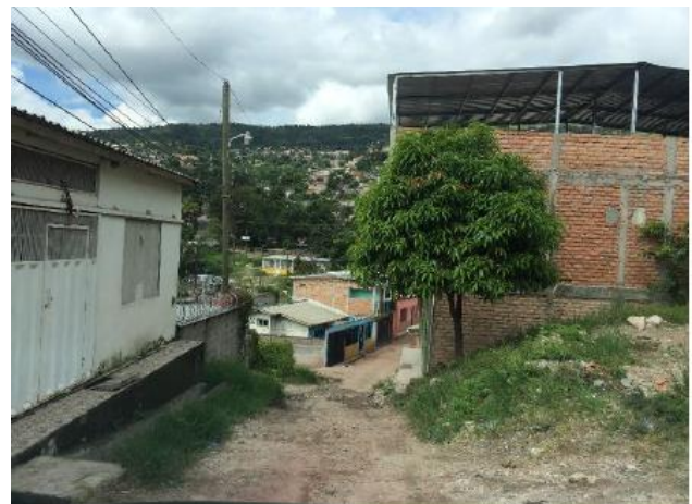
Vista del estado actual de la calle