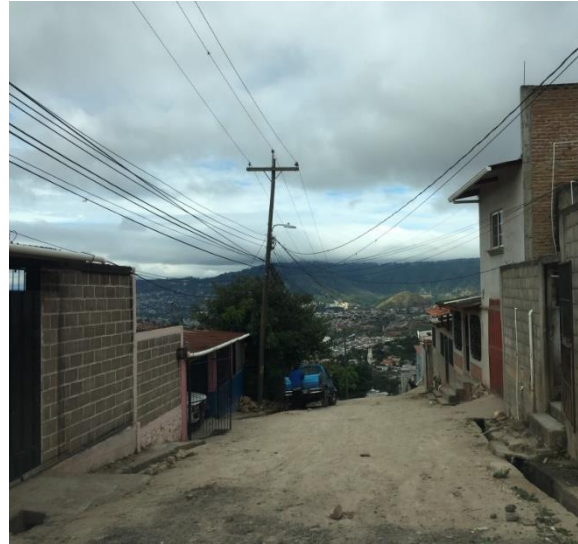
Vista de final de calle a pavimentar.