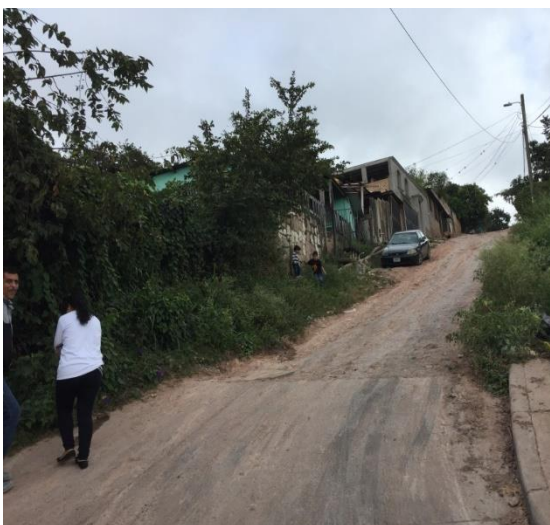
Vista de inicio de obra a ejecutar.