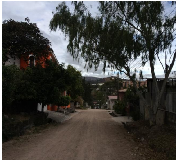
Vista de la calle que se pavimentará.