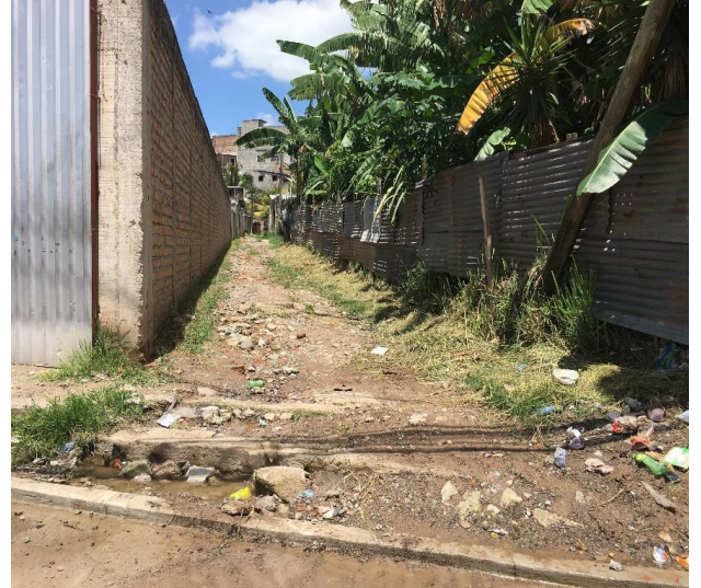
Panorama de callejón a pavimentar con concreto hidráulico.