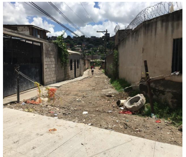
Se observa las malas condiciones de la calle.