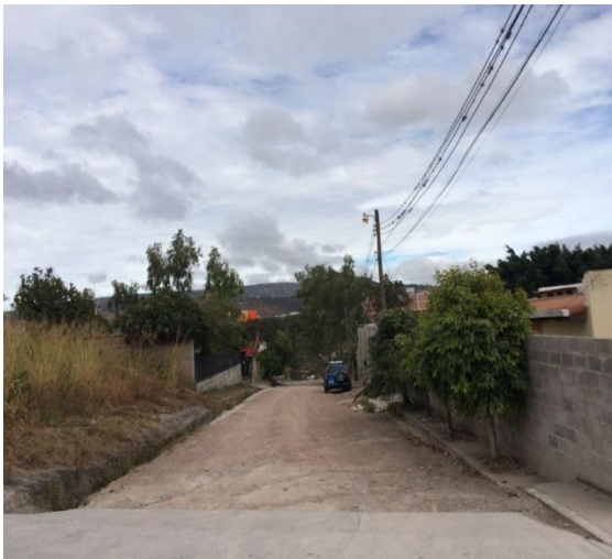
Inicio de calle a pavimentar con concreto hidráulico.