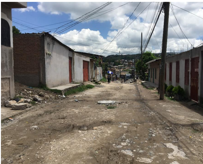
Se observa el mal estado de la calle.