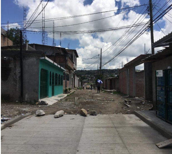
Inicio de calle a pavimentar con concreto hidráulico.