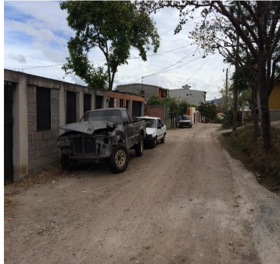
Vista de final de calle a pavimentar.