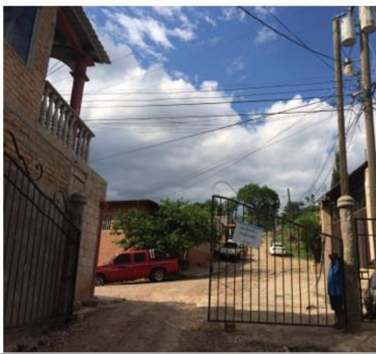
Vista de inicio de obra a ejecutar.