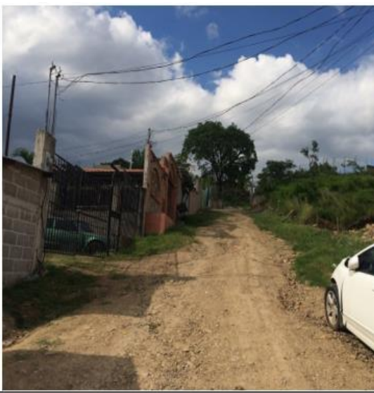
Vista de calle a pavimentar.