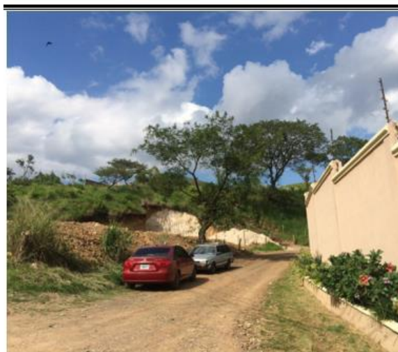
Panorama de calle donde se pavimentara con concreto hidraulico. .