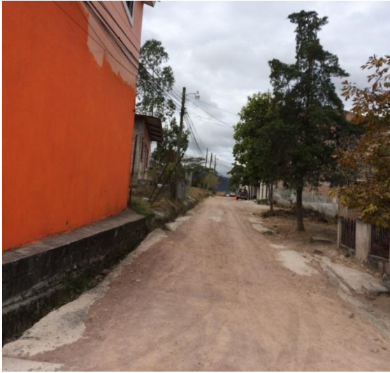
Estado Actual de Calle.