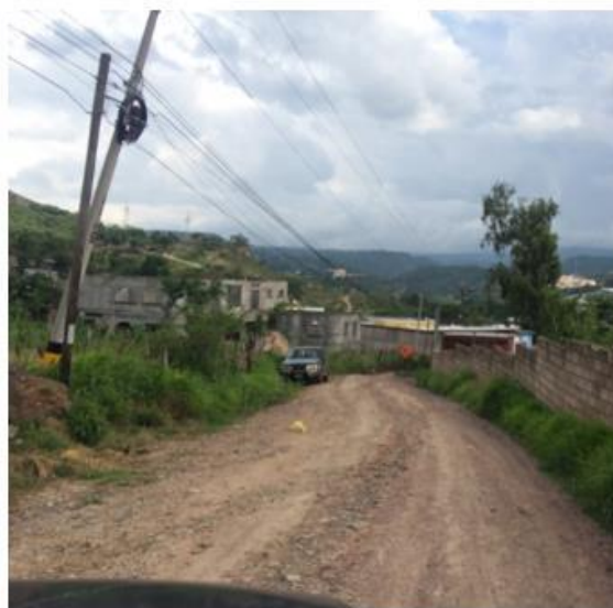
Final de calle a pavimentar.