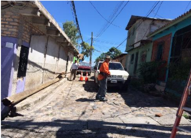
inicio de calle en que se colocará white topping