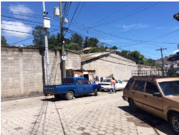
vista de calle a pavimentar