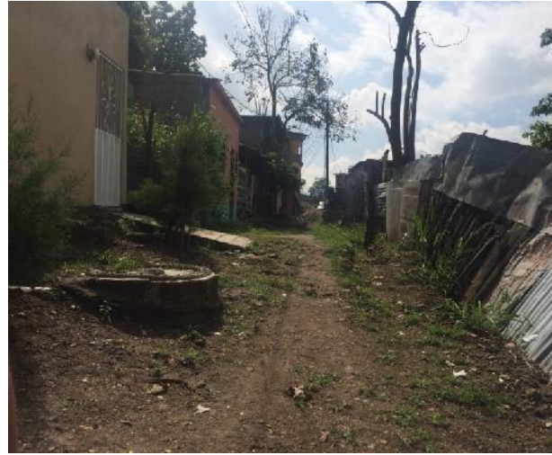
foto #2 condiciones actuales de la calle en la zona donde se construirá muro de contención para retención del talud y ampliación de la calle