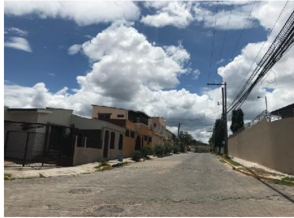
panorama de calle en que se desmontará el adoquín