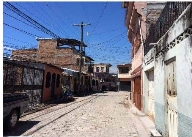
panorama de adoquin a desmontar