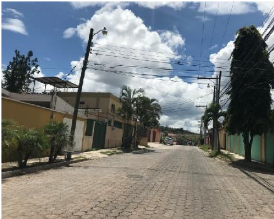
Vista de calle en que se ejecutará la obra