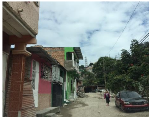
vista del estado de la calle a pavimentar