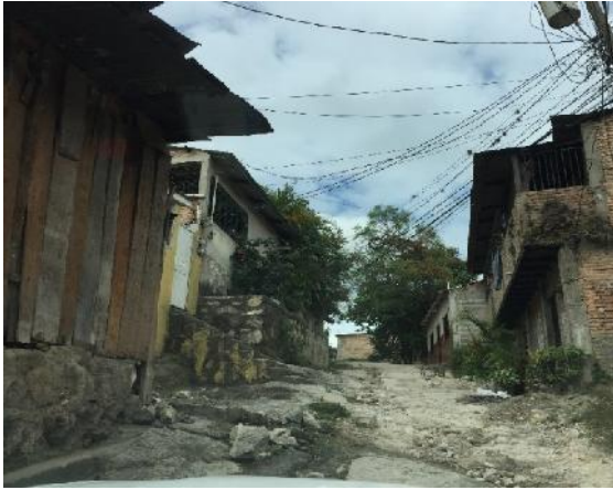
vista de calle en mal estado a pavimentar