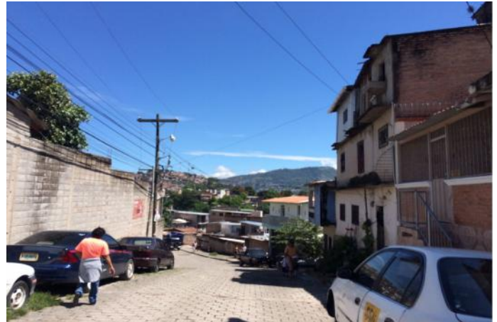
vista de adoquin a desmontar