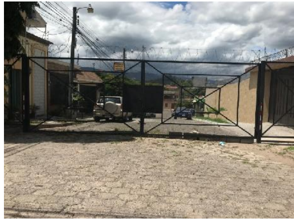
calle a pavimentar con concreto hidráulico