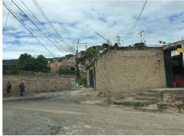
vista panoramica de calle a pavimentar con concreto hidraulico