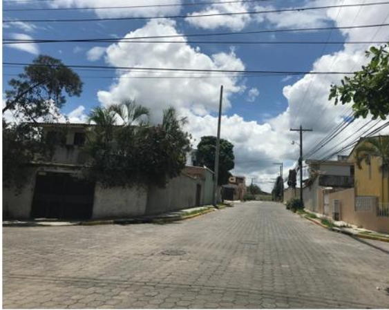
vista de inicio a obra a ejecutar