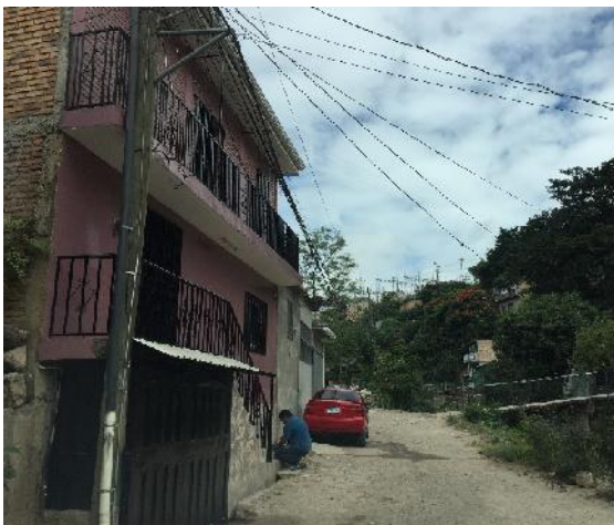
vista de calle donde se pavimentará con concreto hidráulico