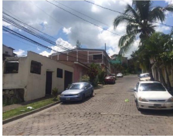
vista de calle en que se ejecutará la obra