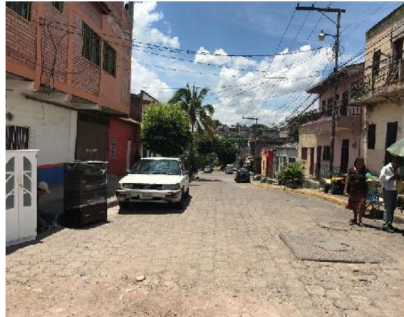
estado actual del adoquin que se desmontara