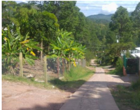
vista de calle en colonia pinares de oriente