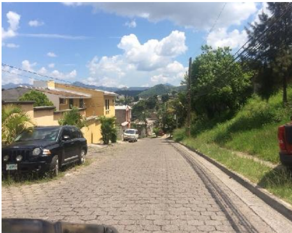
Vista De Calle 1 En Que Se Desmontará El Adoquín Y Se Pavimentará Con Concreto Hidráulico