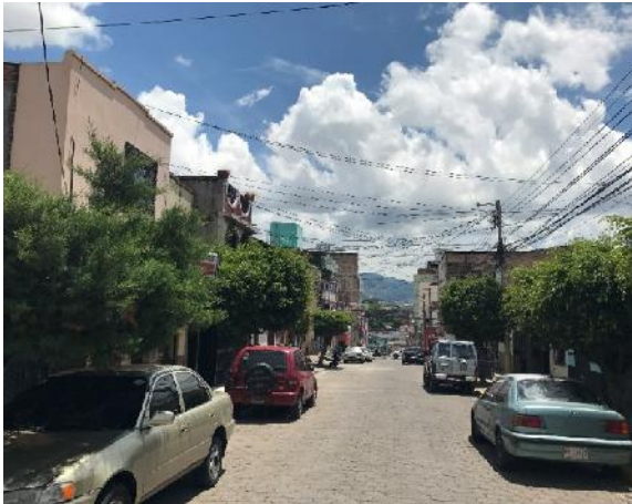
inicio de calle a pavimentar con concreto hidráulico