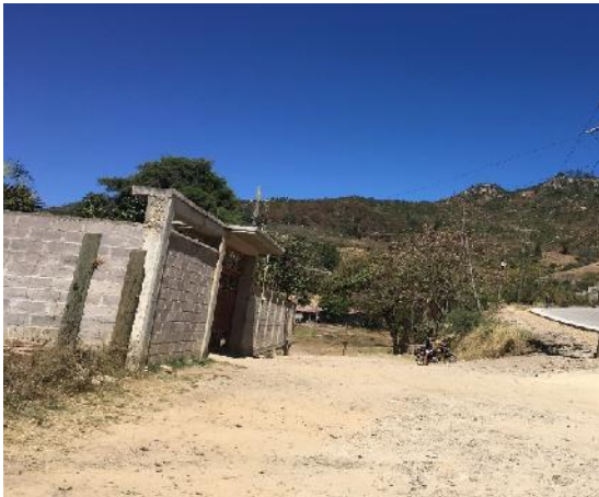
Inicio de calle donde se harán las huellas vehiculares