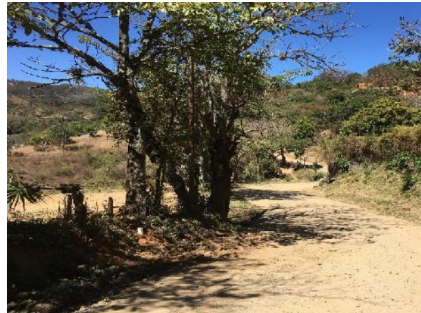
Panorama de calle a reparar