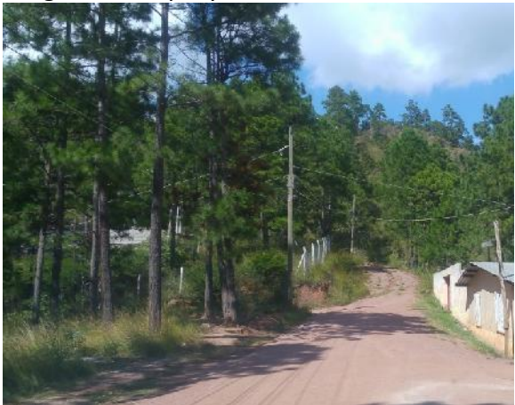
calle en que se construirán las cunetas de mampostería