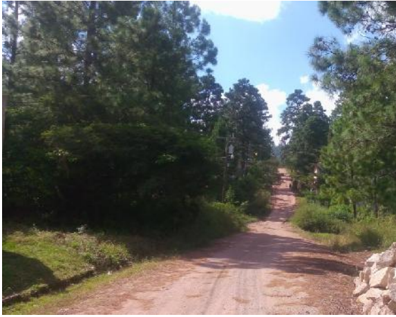
panorama de calle en que se ejecutará la obra