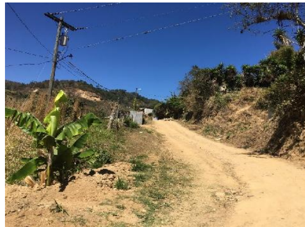
Vista actual del mal estado de la calle