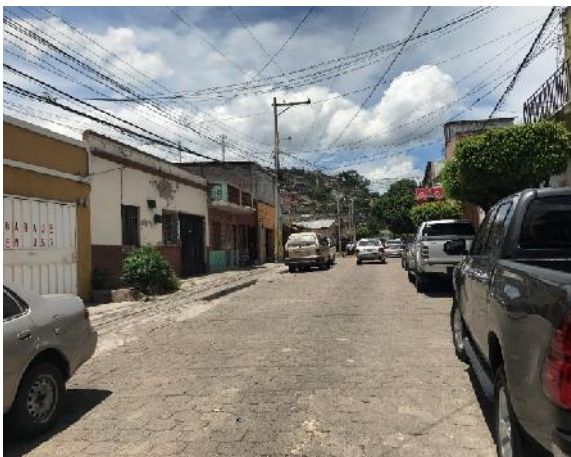
vista de calle a pavimentar con concreto hidráulico