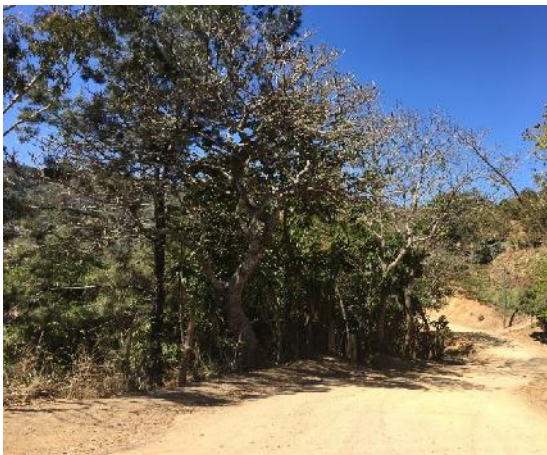
Calle donde se construirán las huellas