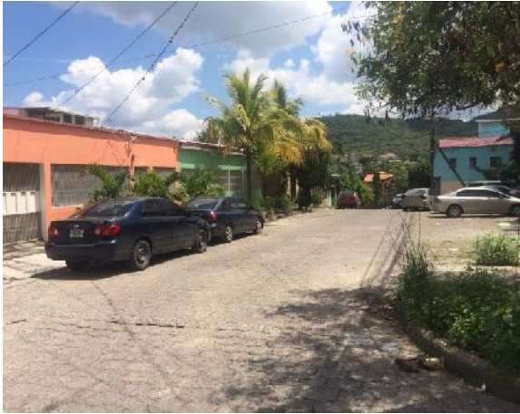
vista de calle donde se desmontara el adoquin