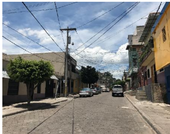
vista de final de la calle a pavimentar