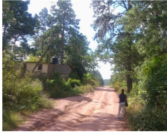
tramo en que se construirán cunetas de mampostería