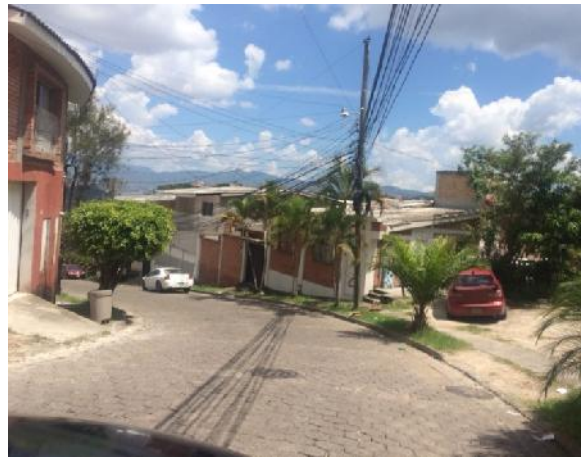
panorama de calle en que se desmontará el adoquín