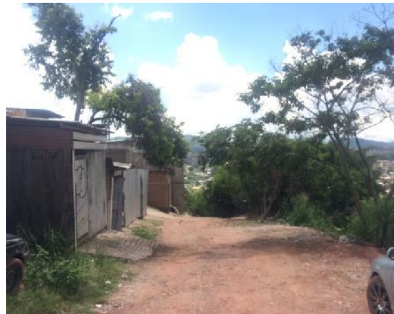
vista panorámica de calle a pavimentar con concreto hidráulico