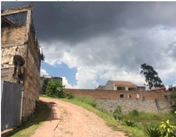
inicio de calle a pavimentar con concreto hidráulico