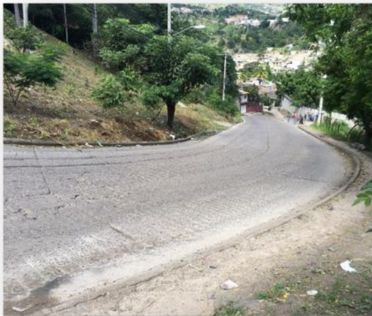
Inicio de calle