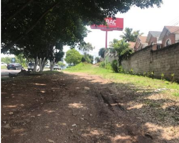
vista de inicio a obra a ejecutar