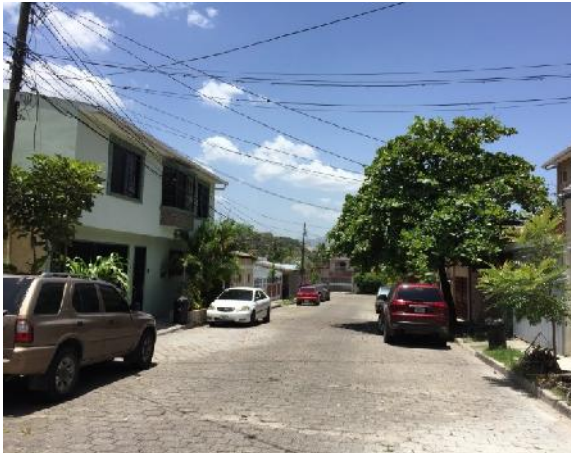
vista de inicio de obra a ejecutar en calle