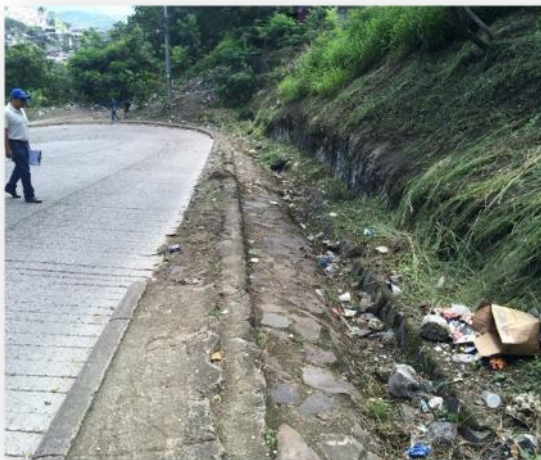
Vista de donde se ampliara la calzada