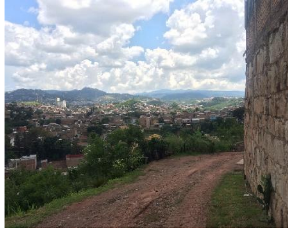
final de calle a pavimentar con concreto hidraulico