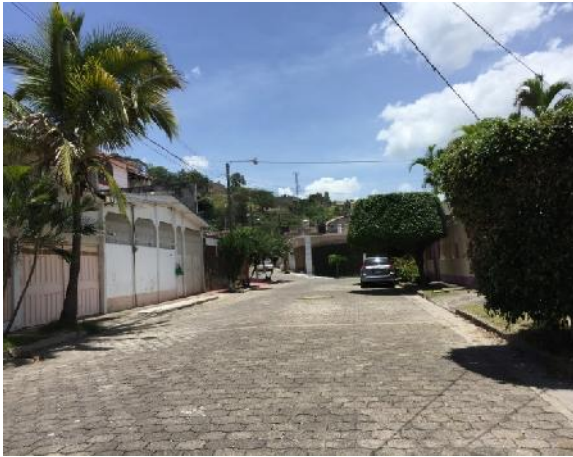
final de calle 1