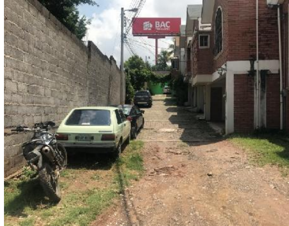
panorama de calle en que se desmontará el adoquín