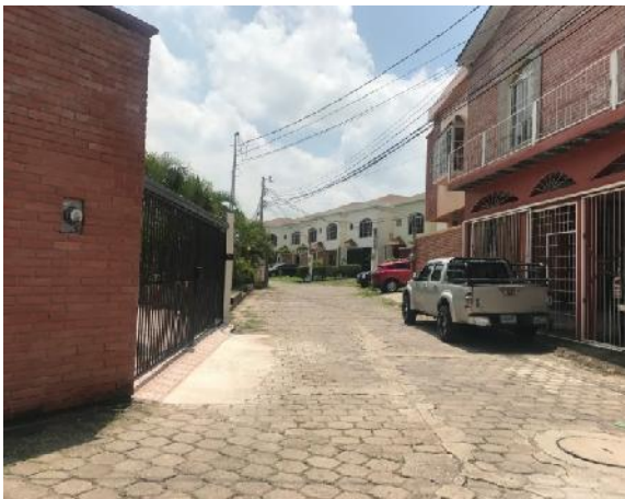
vista de calle en que se ejecutará la obra