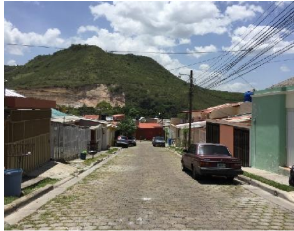
panorama de calle 2