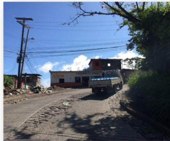
Final de calle a pavimentar