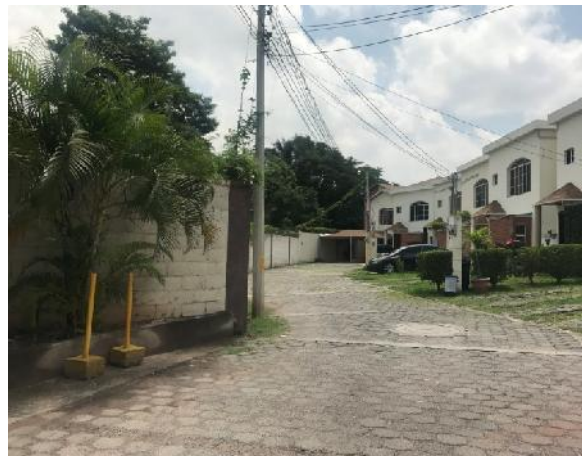
final de obra a ejecutar