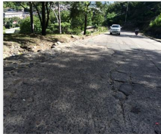
Ubicación del muro de contención