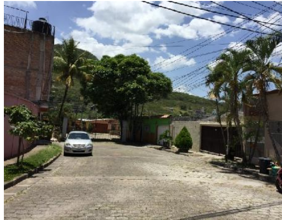
panorama de calle 1 en que se desmontará el adoquín