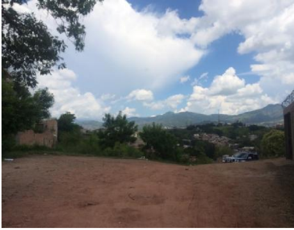
vista del estado actual de la calle