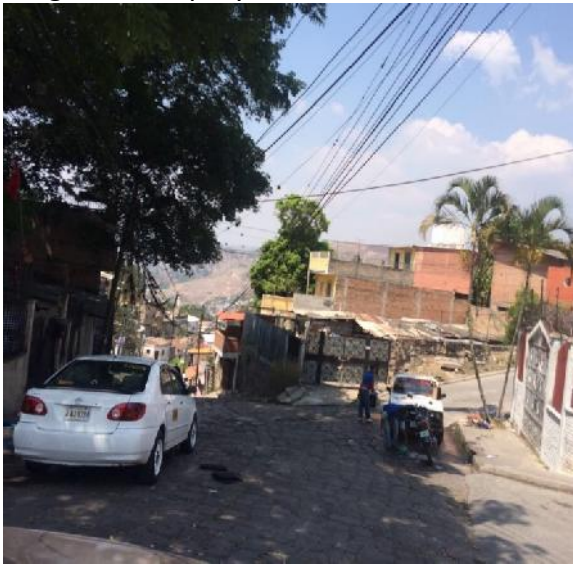
Inicio de calle a pavimentar con concreto hidráulico