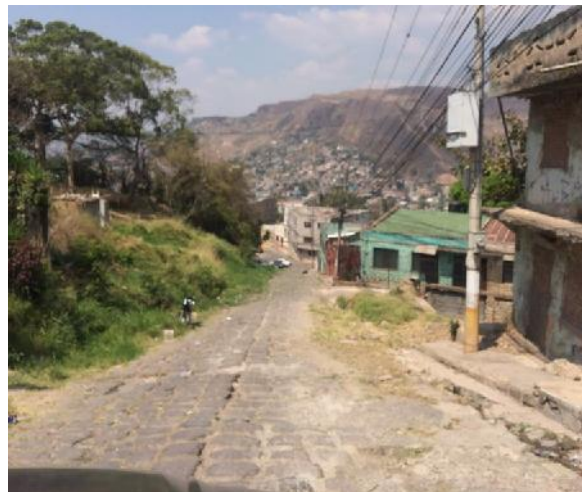
Final de calle a pavimentar