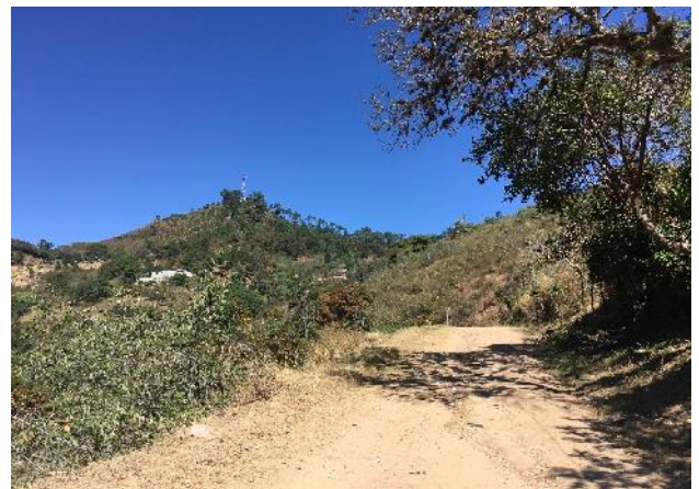
Vista de tramo intermedio de construcción de las huellas vehiculares de concreto hidráulico