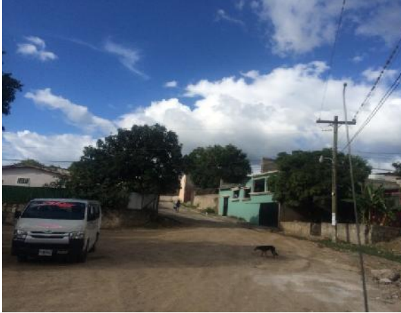
Inicio de calle a pavimentar