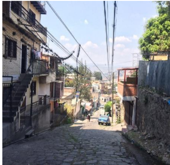
Calle a pavimentar con concreto hidráulico