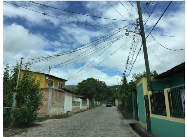
Panorama de tramo a pavimentar con white topping