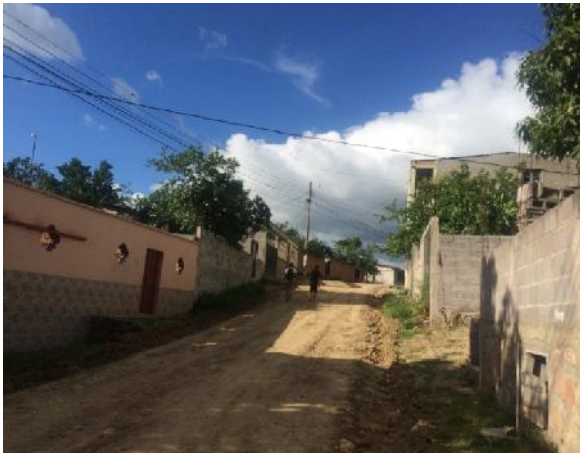
Panoramica de la calle que se pavimentara