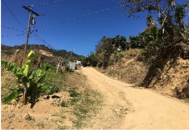
Vista de tramo intermedio de construcción de las huellas vehiculares de concreto hidráulico