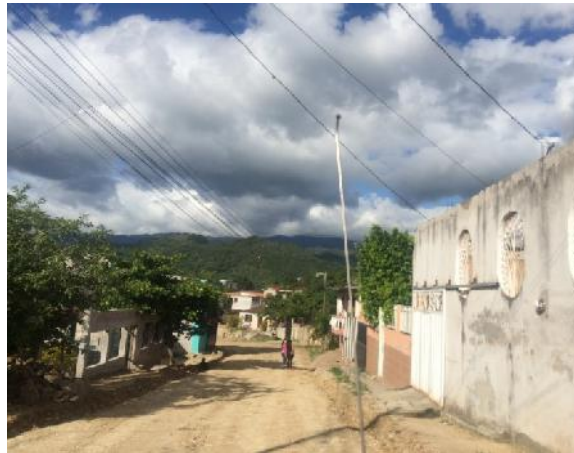
Final de calle a pavimentar