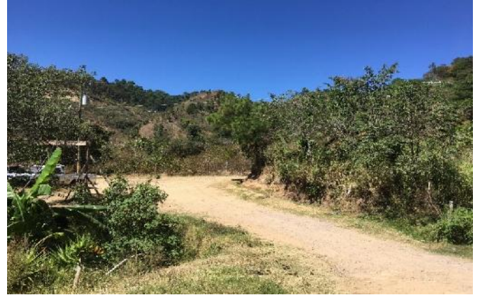
El la imagen se muestra parte del tramo final de construcción de las huellas vehiculares en la aldea el Durazno