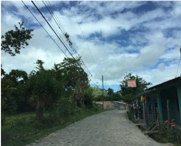
Inicio de white topping