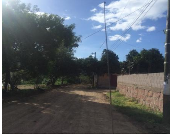
Calle que se pavimentara