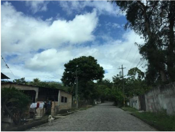
Estado actual de calle