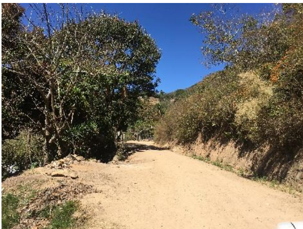
En la imagen se muestra el tramo de inicio de construcción de las huellas vehiculares