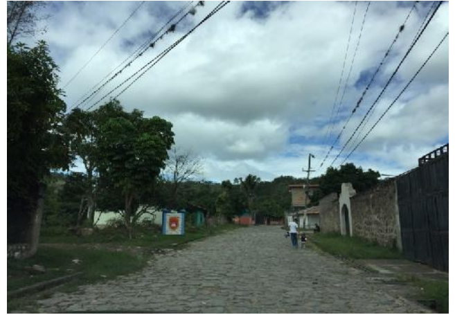
Panorama de calle a pavimentar con white topping