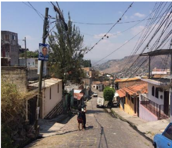
Empedrado existente en mal estado