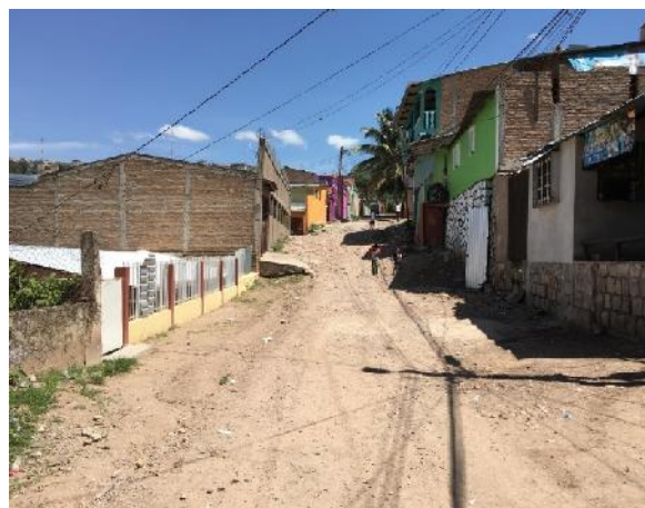
Condiciones actuales de la calle a intervenir con el proyecto en la comunidad de buena vista