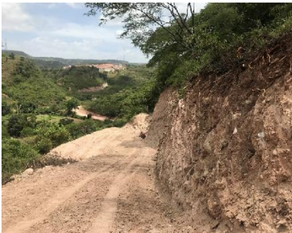
Vista del estado actual de la calle donde se construiran huellas vehiculares