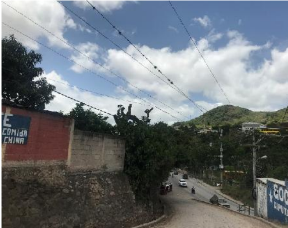
Inicio de calle que se pavimentara con white topping