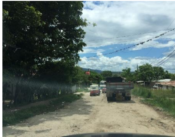
Calle de acceso hacia ciudad España