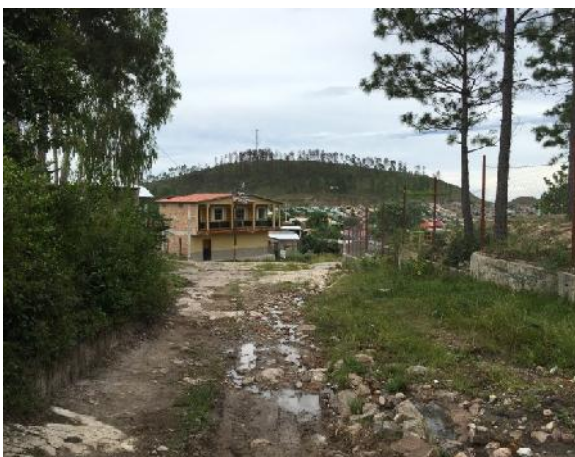
Se observan los problemas de drenaje que dañan la calle