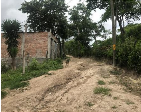
Vista de calle en que se construirán las cunetas y huellas vehiculares