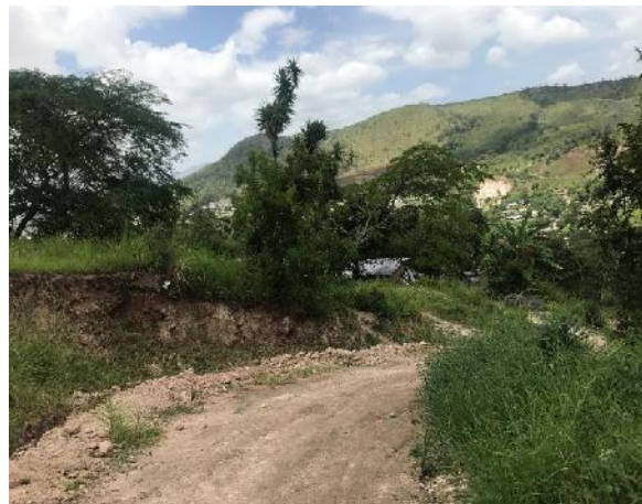
Final de calle en que se ejecutará la obra en aldea la gloria