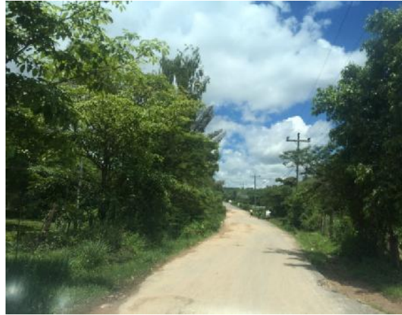
Panorama de calle a pavimentar con doble tratamiento