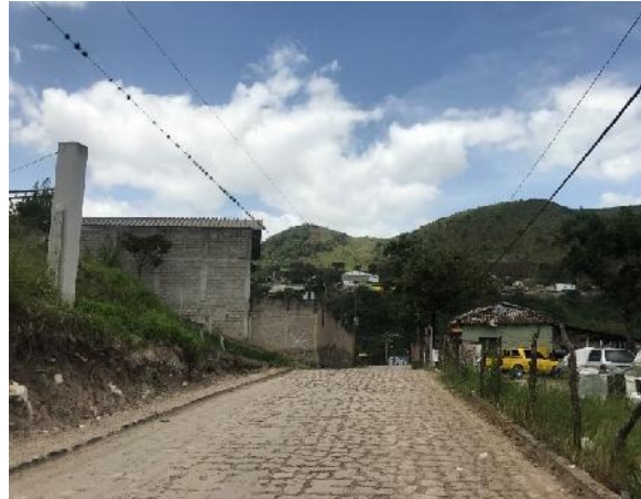
Vista del empedrado sobre el cual se pavimentara