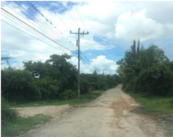
Vista de calle en que se ejecutará la obra