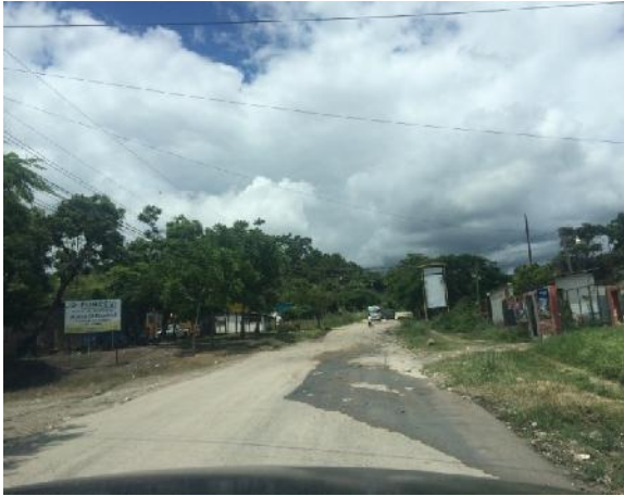
Inicio de calle a pavimentar con doble tratamiento