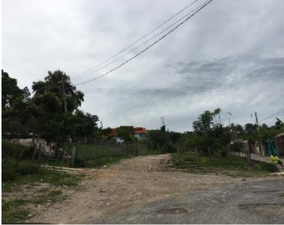
Inicio del proyecto, donde se conectará a la calle de colonia ciudad España