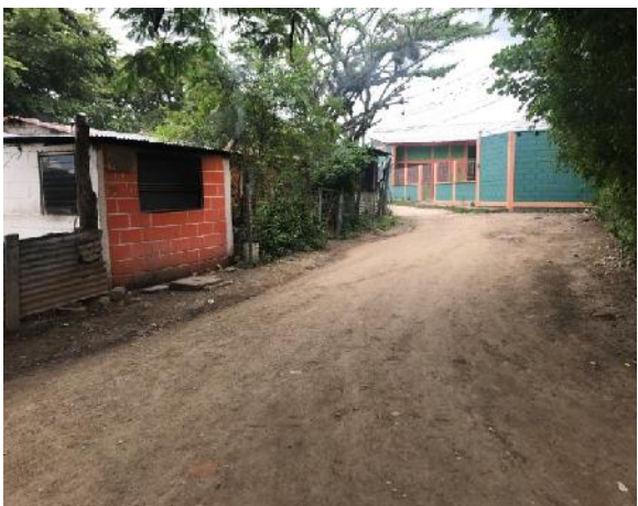
Calle en que se construirán huellas vehiculares