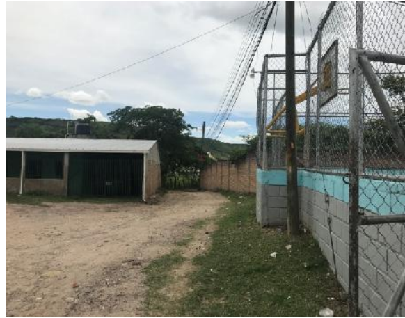
Calle en que se construirán cunetas