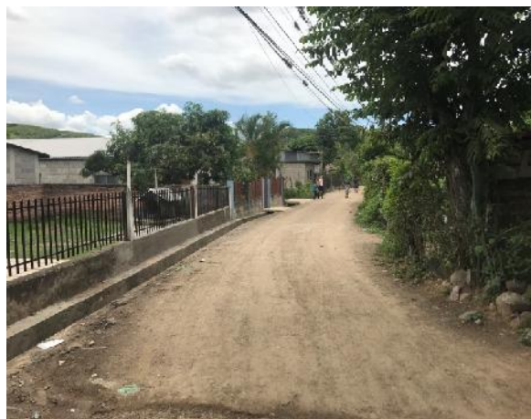
Panorama de calle en que se ejecutará la obra