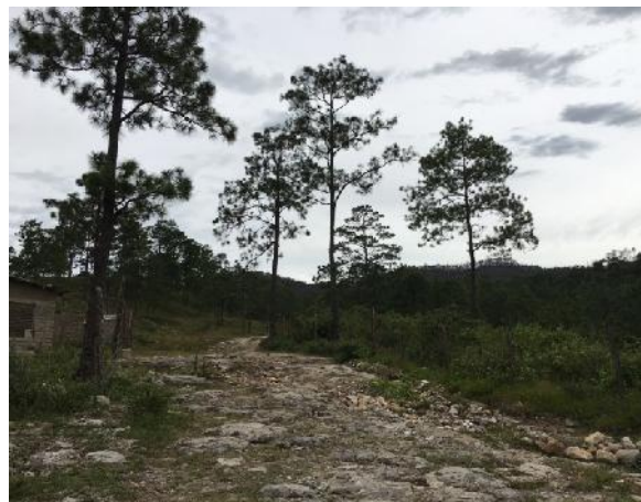
Sitio donde finalizan las huellas de concreto