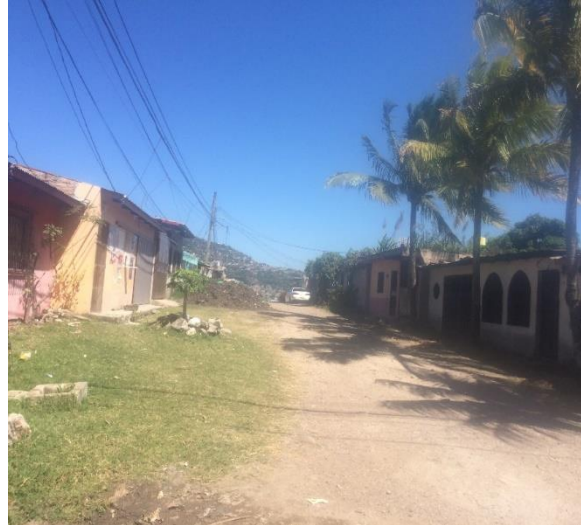
VISTA PANORAMICA DE CALLE A PAVIMENTAR CON CONCRETO HIDRÁULICO.