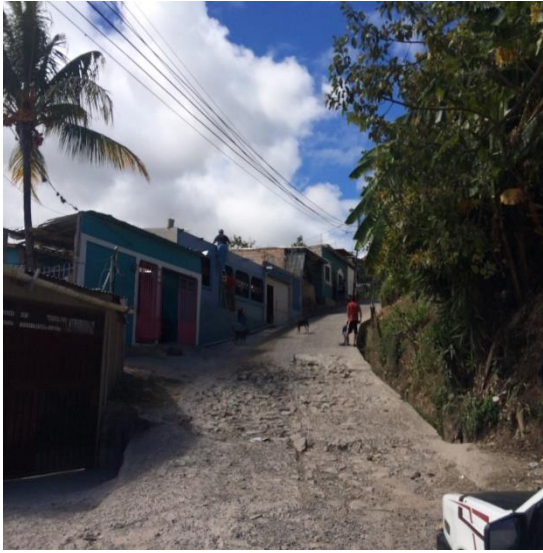
Vista de calle a pavimentar.