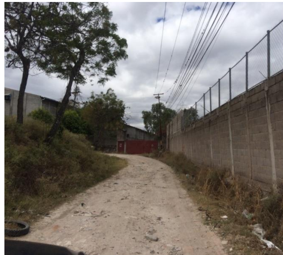
Vista de la calle que se pavimentará y construcción de cunetas.