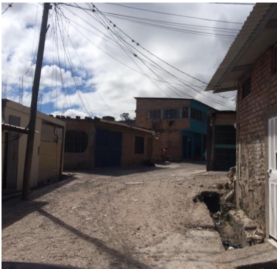
Vista de inicio de obra a ejecutar.