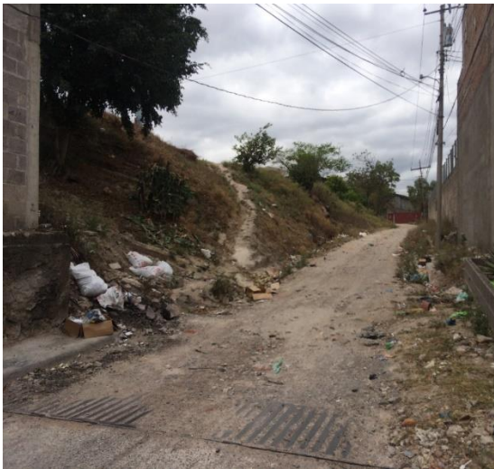
Inicio de calle a pavimentar con concreto hidráulico.