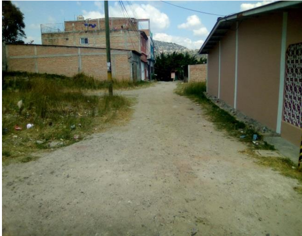
Se observan las condiciones actuales de la calle. Tramo #2, #3, #4 y #5