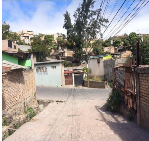
Final de calle a pavimentar.