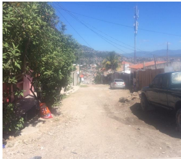
FINAL DE CALLE A PAVIMENTAR CON CONCRETO HIDRAULICO.