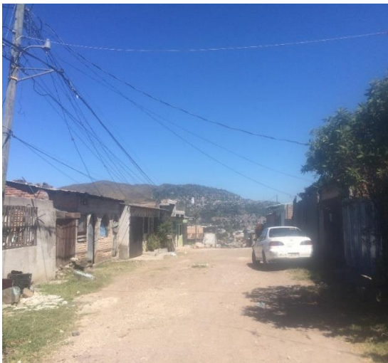
VISTA DEL ESTADO ACTUAL DE LA CALLE