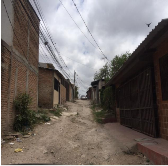
Estado Actual de Calle.