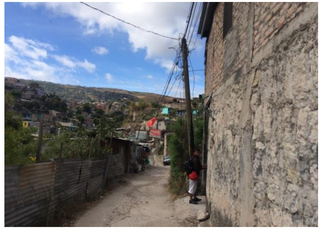
Se observa el ancho y la pendiente del terreno en la calle del tramo #1.