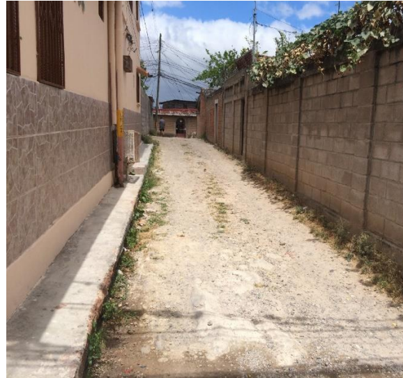
Vista de final de calle a pavimentar.