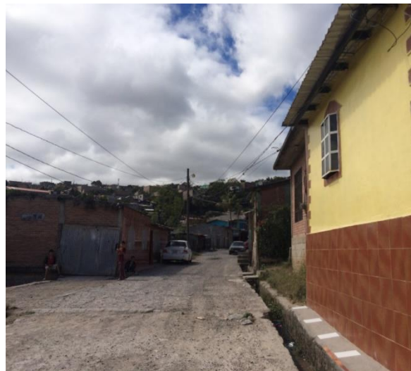
Panorama de calle en col San Juan Bosco.