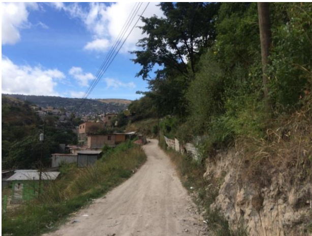
Se observan las condiciones actuales de la calle en el tramo #1.