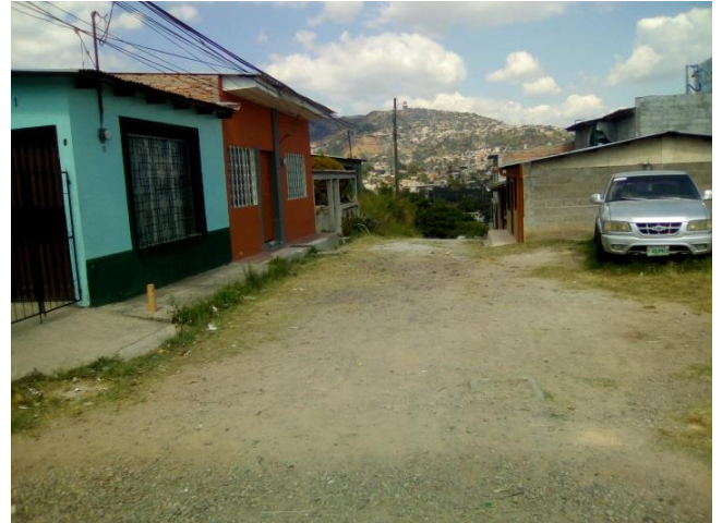
Se observa el tipo de material del terreno natural.