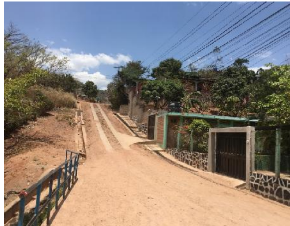
inal de calle a pavimentar con concreto hidráulico