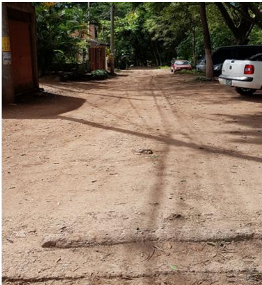
vista del estado actual de la calle