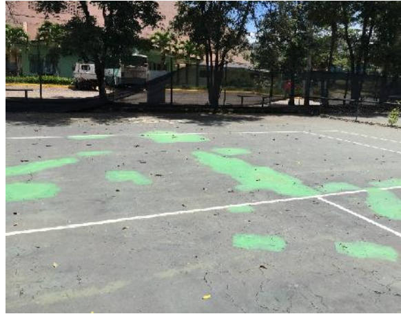
vista del estado actual cancha #2