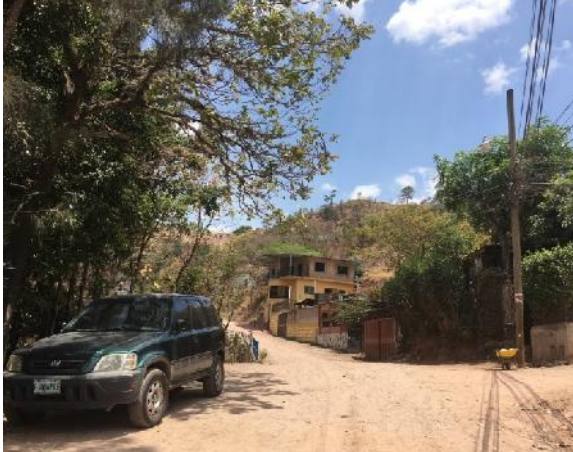
inicio de calle a pavimentar con concreto hidráulico