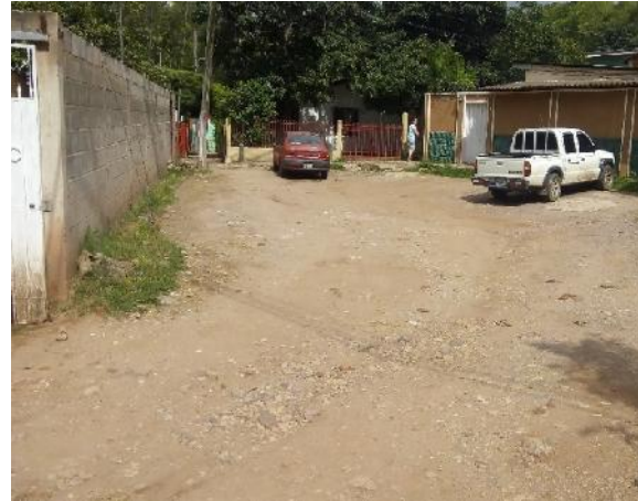
inicio de calle a pavimentar con concreto hidraulico