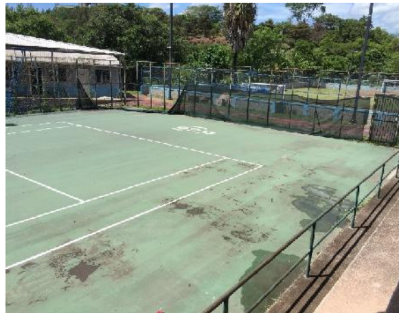
vista de estado actual de cancha #1