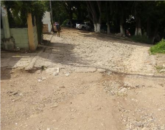
vista del empedrado a demoler