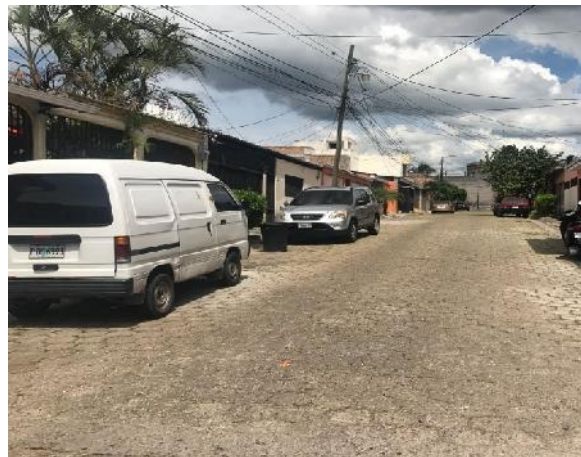
Se observa el estado actual de la calle.