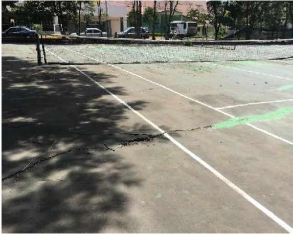
vista cancha #2