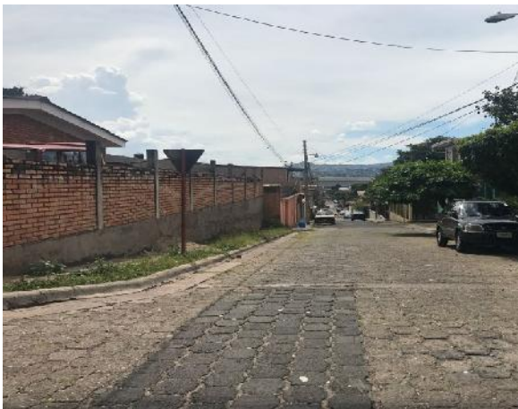
Se observa el desgaste del adoquín