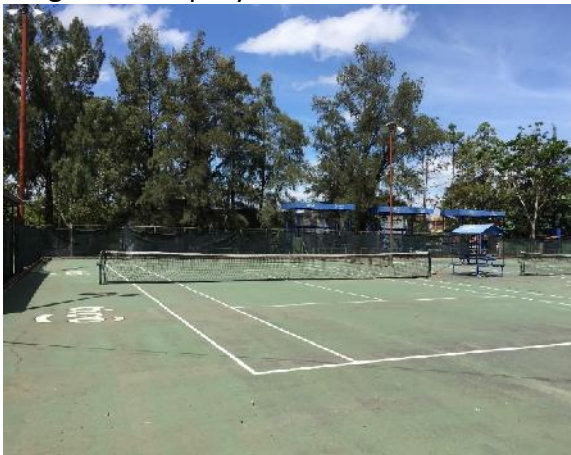
Vista de la cancha #1