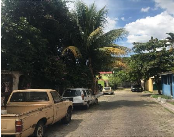
Se observa el estado actual de la calle