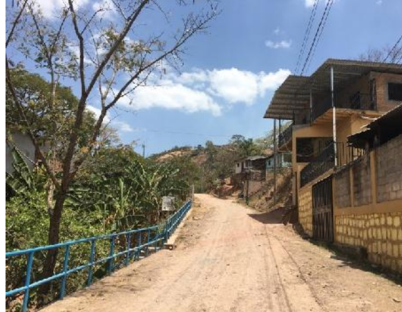
panorama de calle a pavimentar con concreto hidráulico