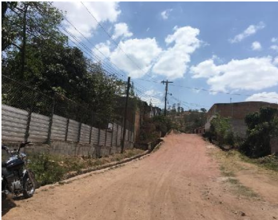
vista de calle a pavimentar con concreto hidráulico