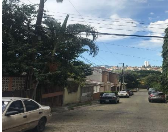
Se observa el estado actual de la calle