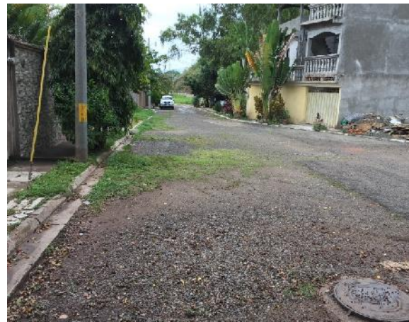
calle a pavimentar con concreto hidraulico