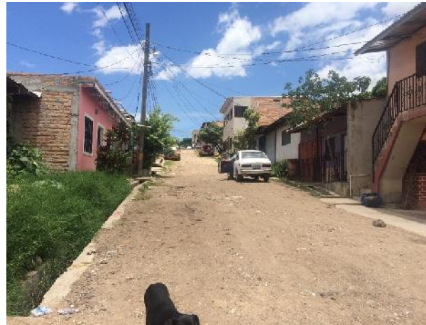
final de la calle a pavimentar con concreto hidráulico