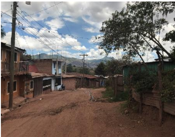
vista panorámica de calle a pavimentar