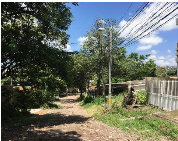
se observa uno de los pozos a nivelar