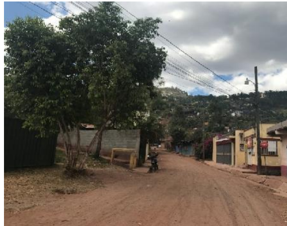
Se observa el estado actual de la calle