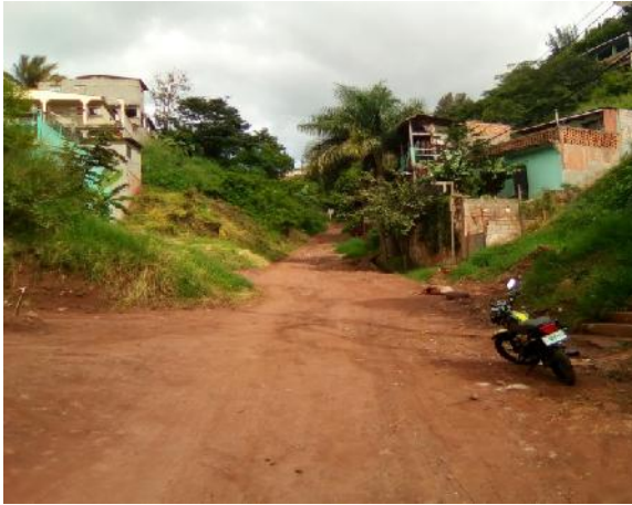
Se observa el estado actual de la calle y el ancho del derecho de vía