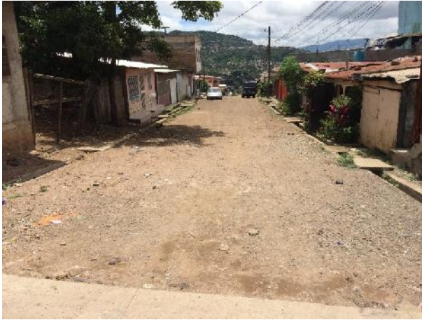
inicio de calle a pavimentar con concreto hidráulico