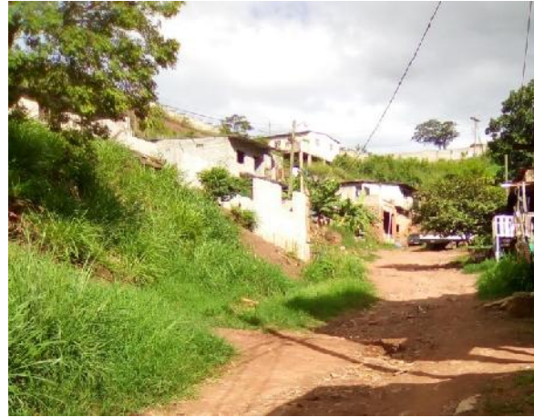
Se observa el estado actual de la calle, la pendiente del terreno natural y el ancho de la vía