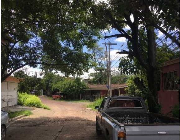
inicio de calle a pavimentar con concreto hidráulico