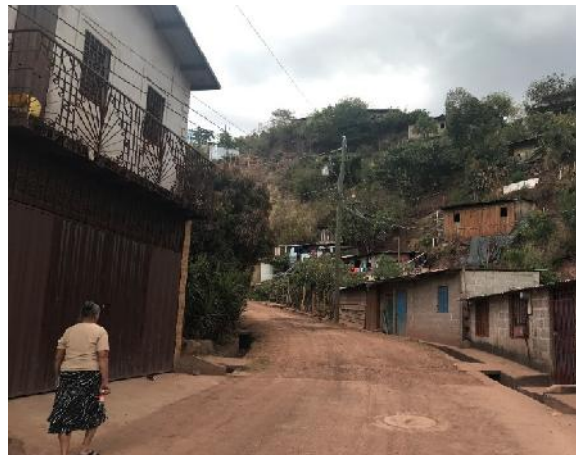
Se observa el final del proyecto