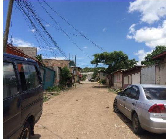
vista panoramica de calle a pavimentar con concreto hidráulico