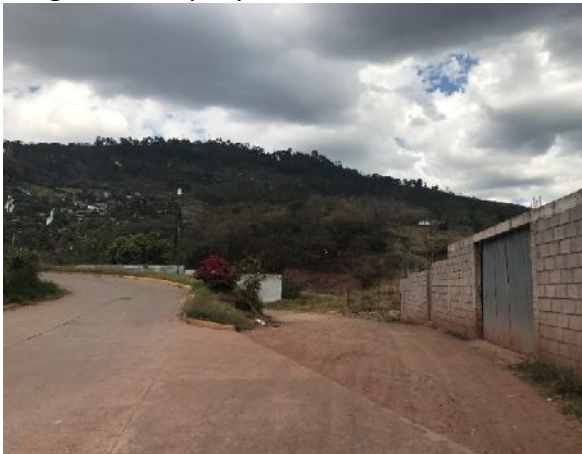
Se observa el inicio del proyecto