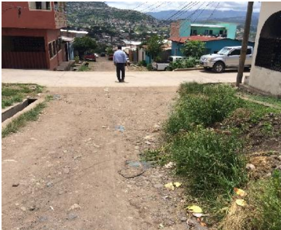
vista del estado actual de la calle