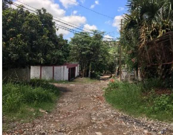
panorama de calle a pavimentar con concreto hidráulico