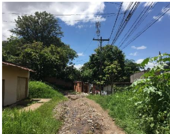
se observa el mal estado de la calle