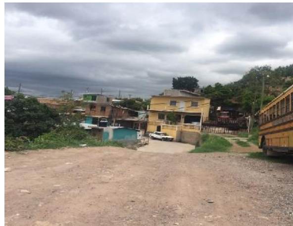
Calle a pavimentar conecta con la calle de acceso de la col. Villa Cristina