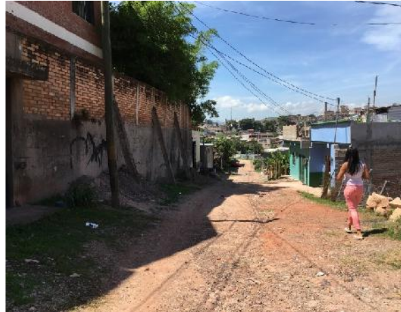
vista tramo intermedio de calle a pavimentar