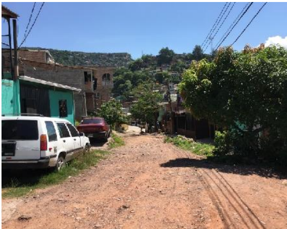
vista panorámica de calle a pavimentar