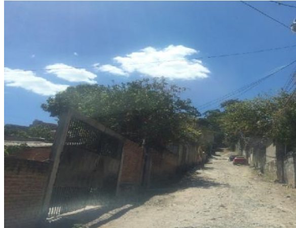
vista de la calle a pavimentar con concreto hidráulico