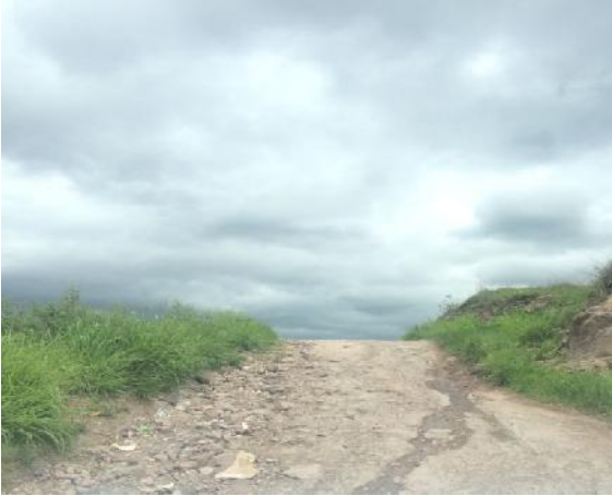
Situación actual de la calle, ancho de vía y pendiente del terreno