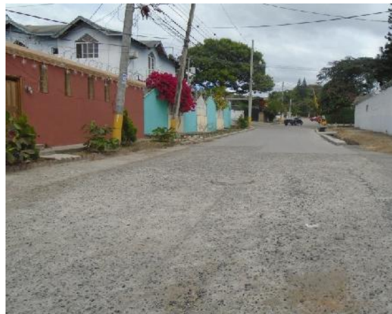
vista de la calle a pavimentar sobre la losa existente