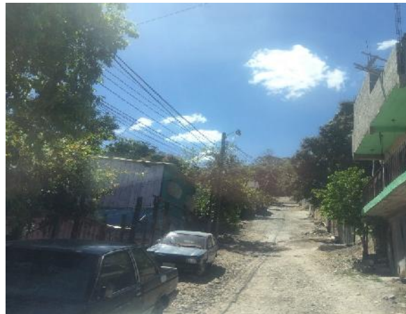
final de la calle a pavimentar