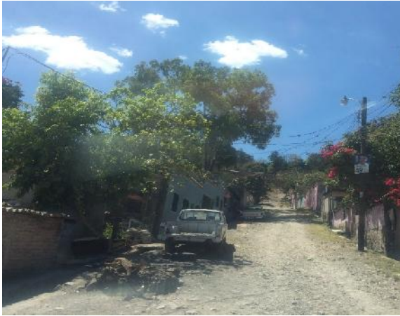
inicio de calle a pavimentar