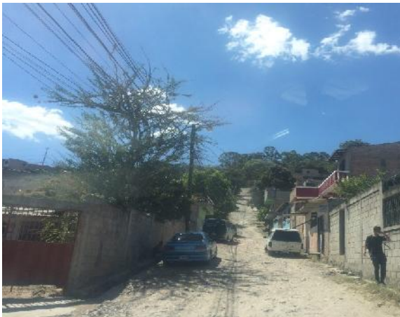
se observa el mal estado de la calle