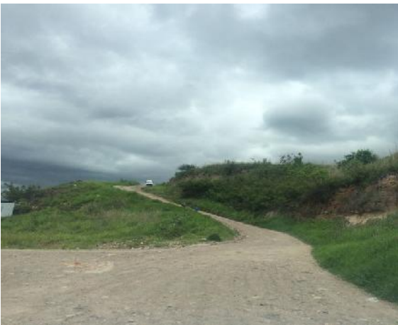
Situación actual de la calle, ancho de vía y pendiente del terreno