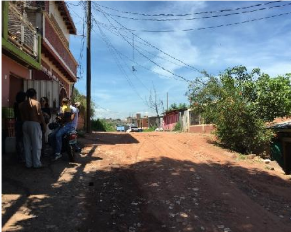
vista de estado actual de calle a pavimentar