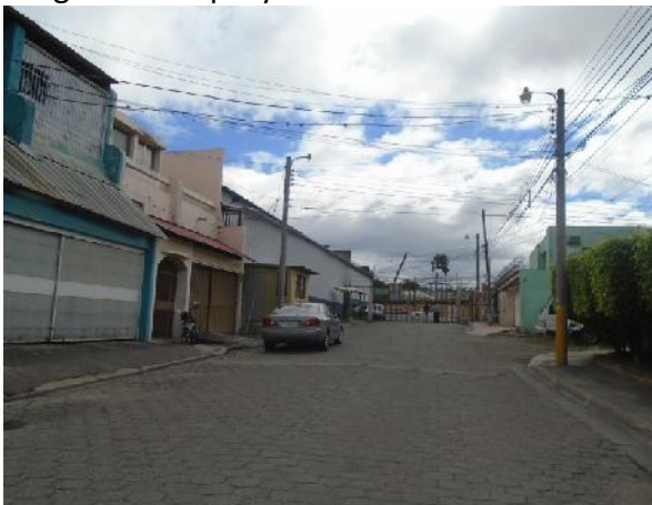
vista de la calle a pavimentar con concreto hidráulico