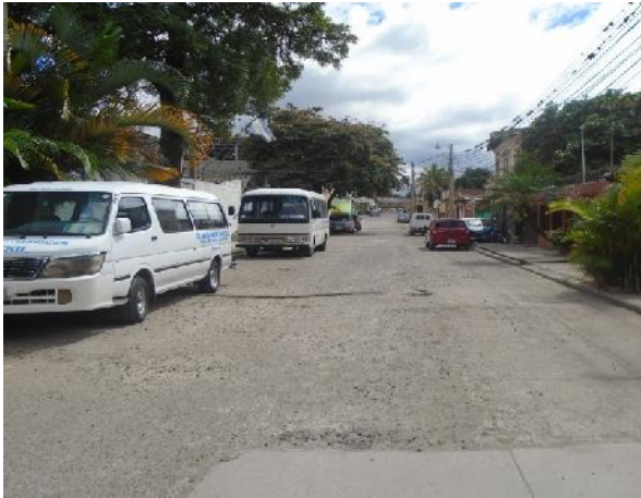
vista de calle con losa existente en mal estado