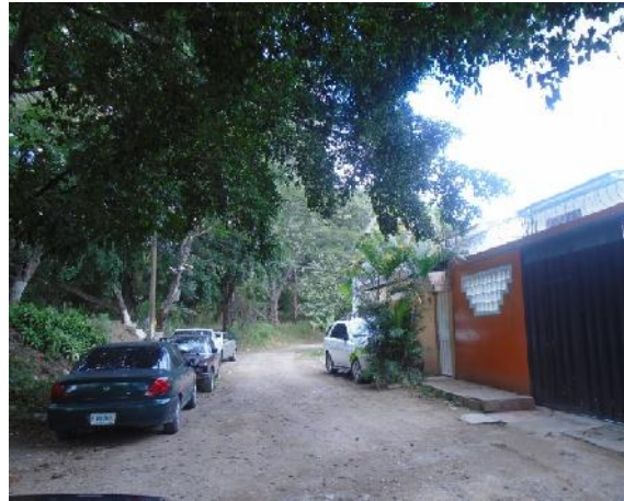
calle a pavimentar con concreto hidraulico