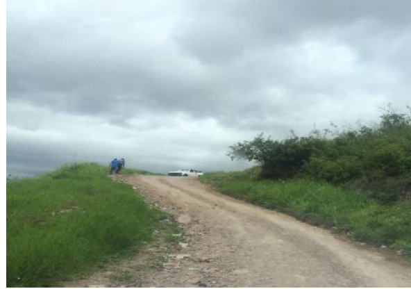
Situación actual de la calle, ancho de vía y pendiente del terreno