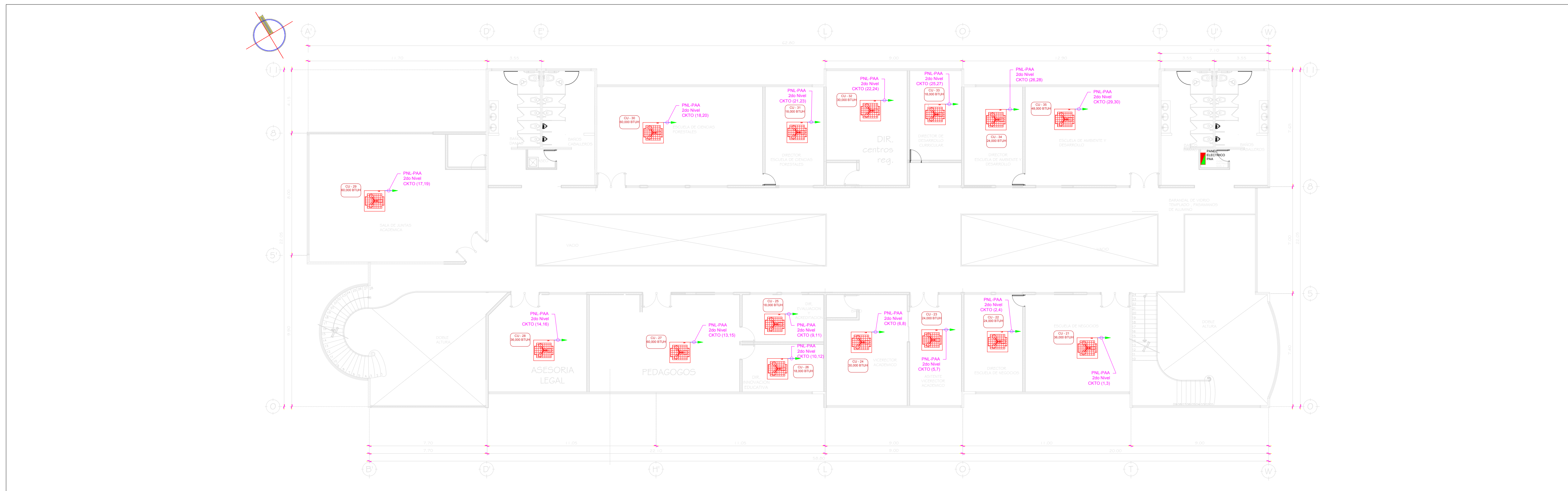
PLANO CONDENSADORES OFICINAS ADMIN. DE 2do NIVEL