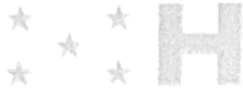
CUADRO No. 3