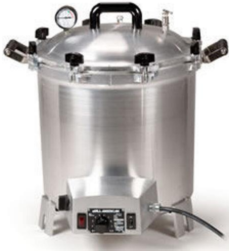
AUTOCLAVE- ALL AMERICAN MESA