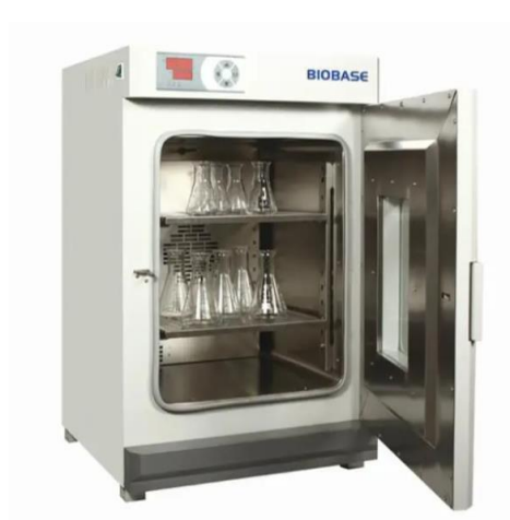
INCUBADORA ESTUFA. BIOBASE