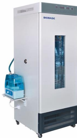
INCUBADORA PARA DBO- BIOBASE