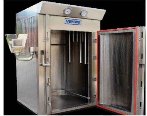
HORNO DE PASTEURIZACION