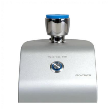
SISTEMA DE FILTRACION DE VACIO- WATERVAC