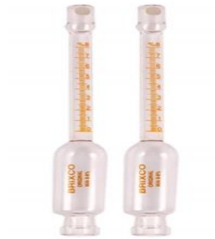
VIDEDRIA PARA LAB. (VARIOS)