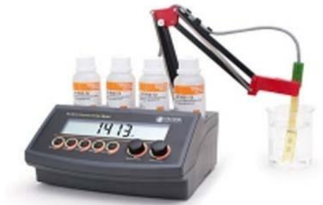
MEDIDOR DE CONDUCTIVIDAD- HANNA