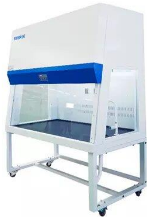
CAMPANA EXTRACTORA DE GASES-BIOBASE