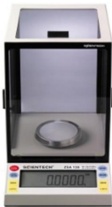
BALANZA ANALITICA- HACH