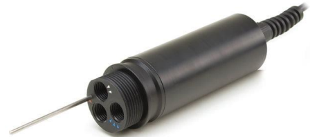
SONDA MULTIPARAMETRICA- HANNA