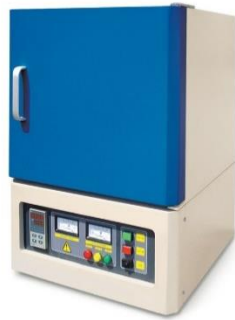
MUFLAS PARA ALTA TEMPERATURA