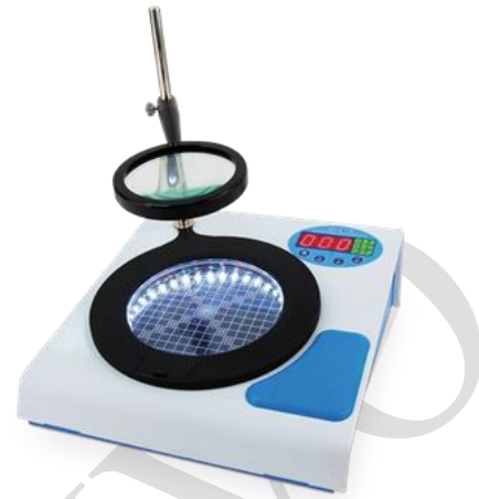
CONTADOR DE COLONIAS- ROCKER