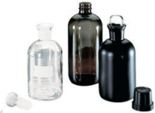
FRASCO PARA DBO- HACH