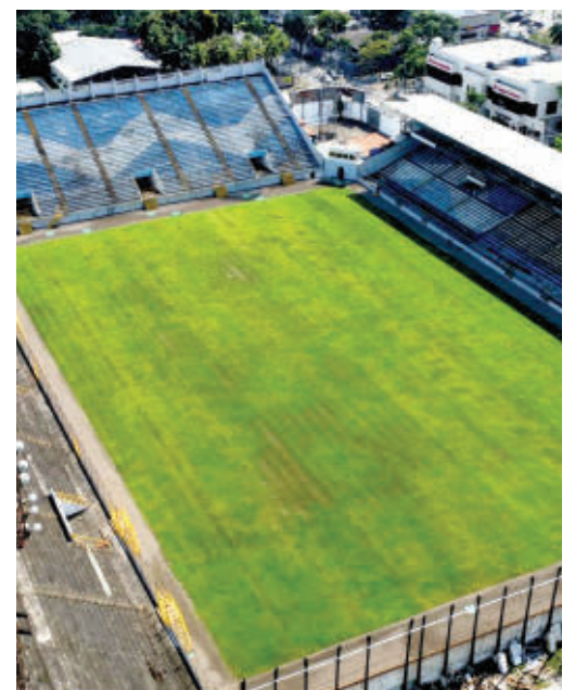
TRATAMIENTO. La grama del Morazán está contaminada con hongos y no se podrá jugar en meses.