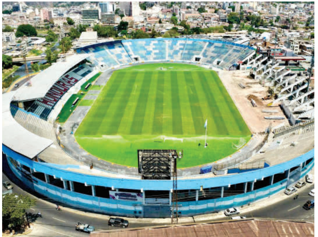
ELEGIDO. El estadio Nacional Chelato Uclés recibe remodelaciones en la gradería de sol.

Para mayo el cuerpo técnico busca los espacios para los entrenamientos y prácticamente con un mes para el duelo ante Cuba. El próximo mes trae de inicio la liguilla, semifinales y final. Tras el final del torneo Clausura, la Bicolor tendrá alrededor de 15 días previos para la mirada al 100% contra Cuba.