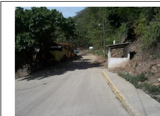
Fotografía No. 12.(1) Inicio del proyecto en intersección con carretera CA-5 Sur