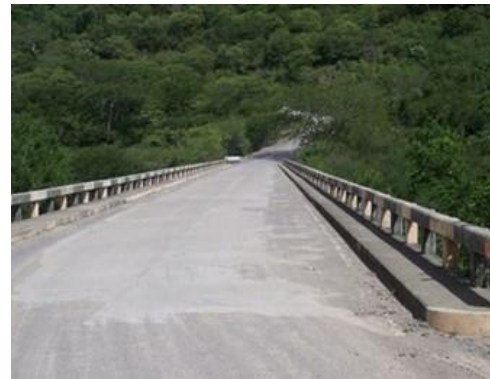
Fotografía No. 12.(2) Puente sobre Río Grande en Km 8+600