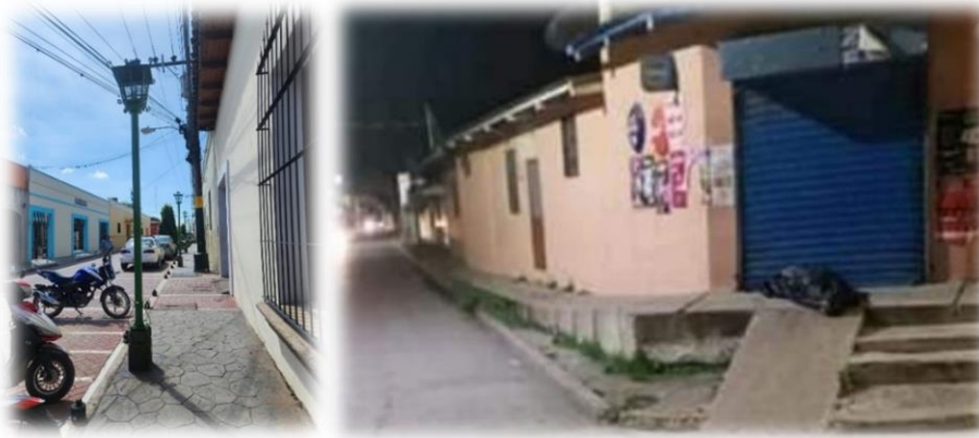
Ilustración 2 Fotografías de situación actual, irregularidades y obstaculización de movilidad, Comayagua, Honduras