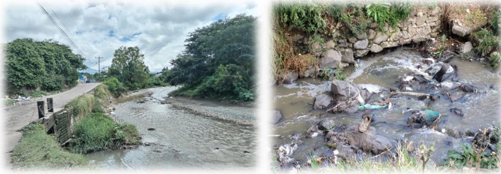
Ilustración 1 Situación actual del Río Chiquito