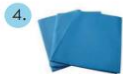
Sabana descartable (2 x 1.5m)