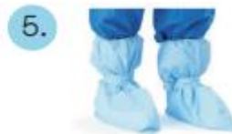
Cubre-calzado impermeable tipo bota