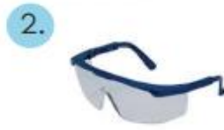
Protección facial o gafas (anti-empañante)