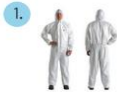
Mameluco impermeable, para riesgo biológico