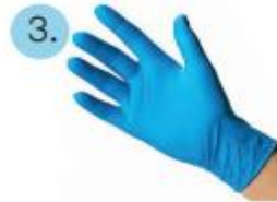
2 pares de guantes de nitrilo