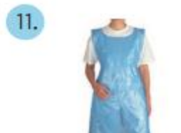
Delantal nylon descartable