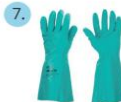
1 par de guantes nitrilo largos