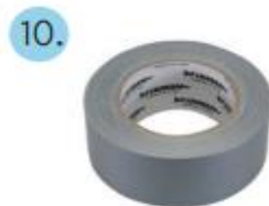
Cinta ancha de baja adherencia