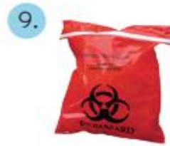
Recipiente, bolsa roja de residuos bio-peligrosos y precinto cierre