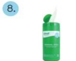
Toallas descartables impregnadas en cloro